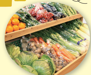
野菜売場(イメージ)