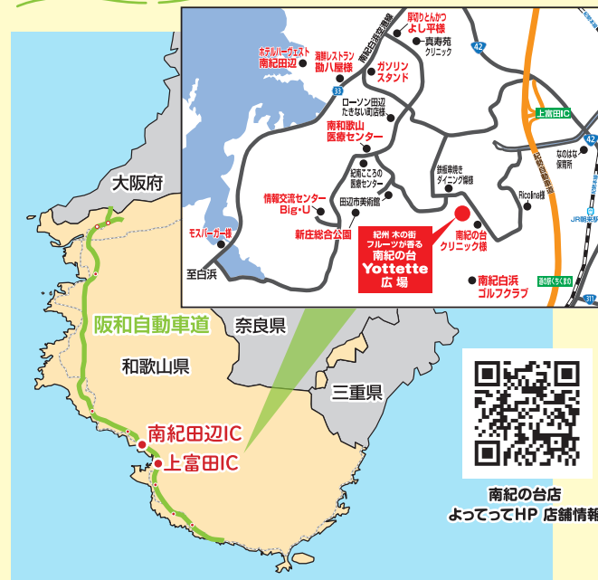
南紀の台店 よってってHP 店舗情報