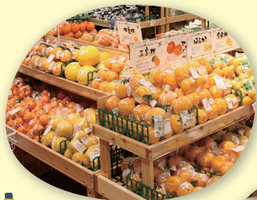
果物売場(イメージ)