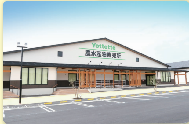
▲農水産物直売所 外観

農水産物直売所では、地元生産者さんの新鮮な農産物をはじめ、漁業者さんが直接出荷する魚介類や選りすぐりの加工品、紀州和歌山のお土産品を豊富に品ぞろえ。館内で作る焼きたてパンもおすすめです。