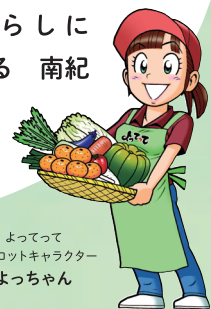
よってって マスコットキャラクター よっちゃん