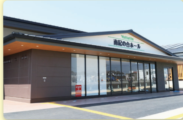
▲南紀の台ホール 外観

南紀の台ホールは、コンサートホールの機能のほか、講演会会場や休憩所としてもご利用いただけます。みかんや柿など、旬の産物の販売スペースにもなり、生産者さんのこだわり動画も放映します。