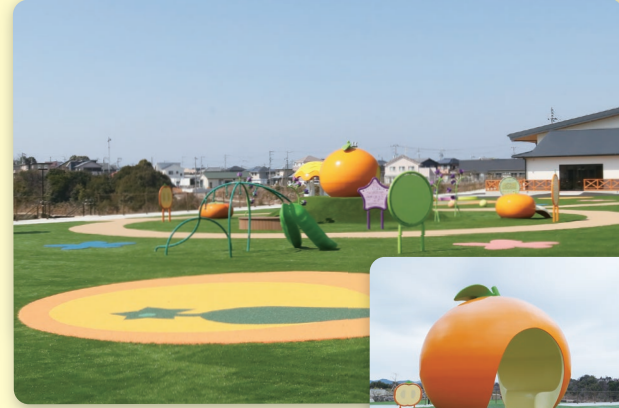
▲フルーツ公園 全景

フルーツ公園は、みかんや柿、いちじく、梅などの和歌山県が生産量第1位の農産物のオブジェをはじめ、ボルダリングができる遊具などでお子様と一緒に楽しめるプレイゾーンです。