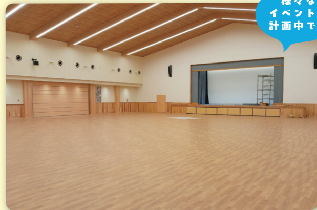
▲南紀の台ホール 内観